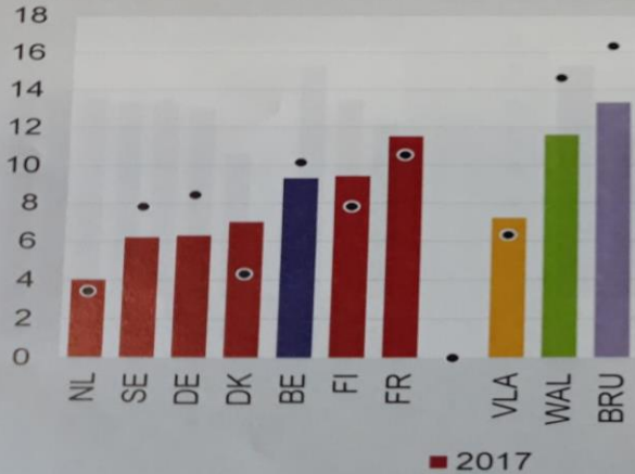
NEET (in % van de 15-24-jarigen)